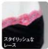
スタイリッシュな レース