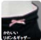
かわいい リボン&ギャザー