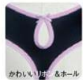
かわいらしいポン &ホール