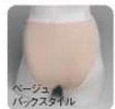
ベージュ バックスタイル