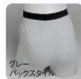
グレー バックスタイル