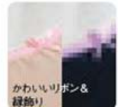
かわいらしいポン & 縁飾り