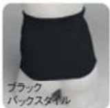
ブラック バックスタイル