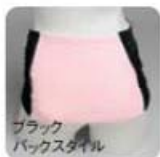
ブラック バックスタイル