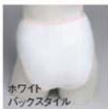
ホワイト バックスタイル