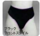
ブラック フロントスタイル