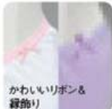
かわいらしいポン & 縁飾り