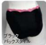
ブラック バックスタイル